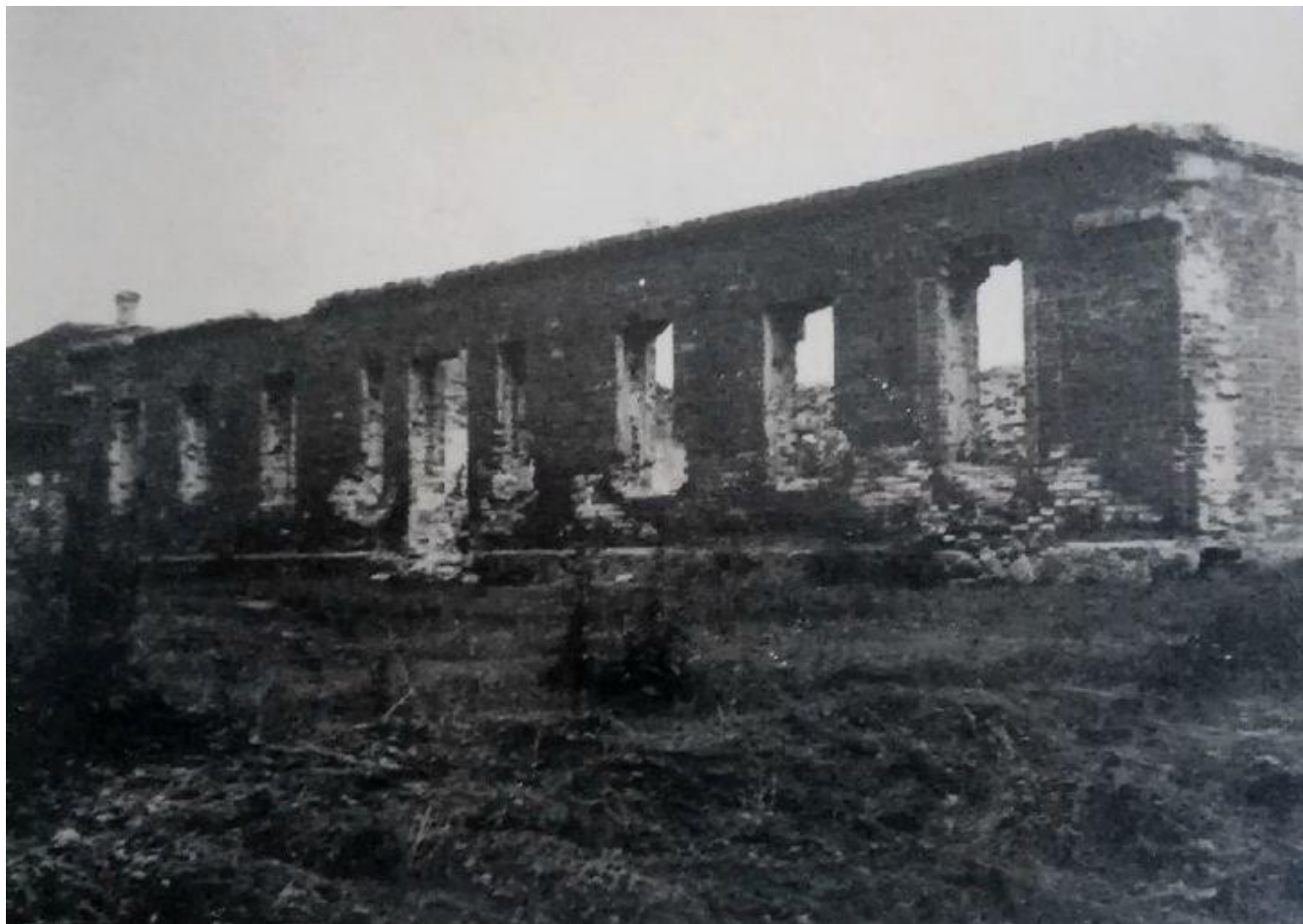
Васильев В.И. Загадка школы в Звонах

В качестве послесловия к работе В. И. Васильева А. В. Кондратеня предоставил архивную фотографию Звонской школы после военного периода. С большой долей вероятности можно считать, что это центральная часть того самого здания на плане. А второй этаж был достроен много позже.