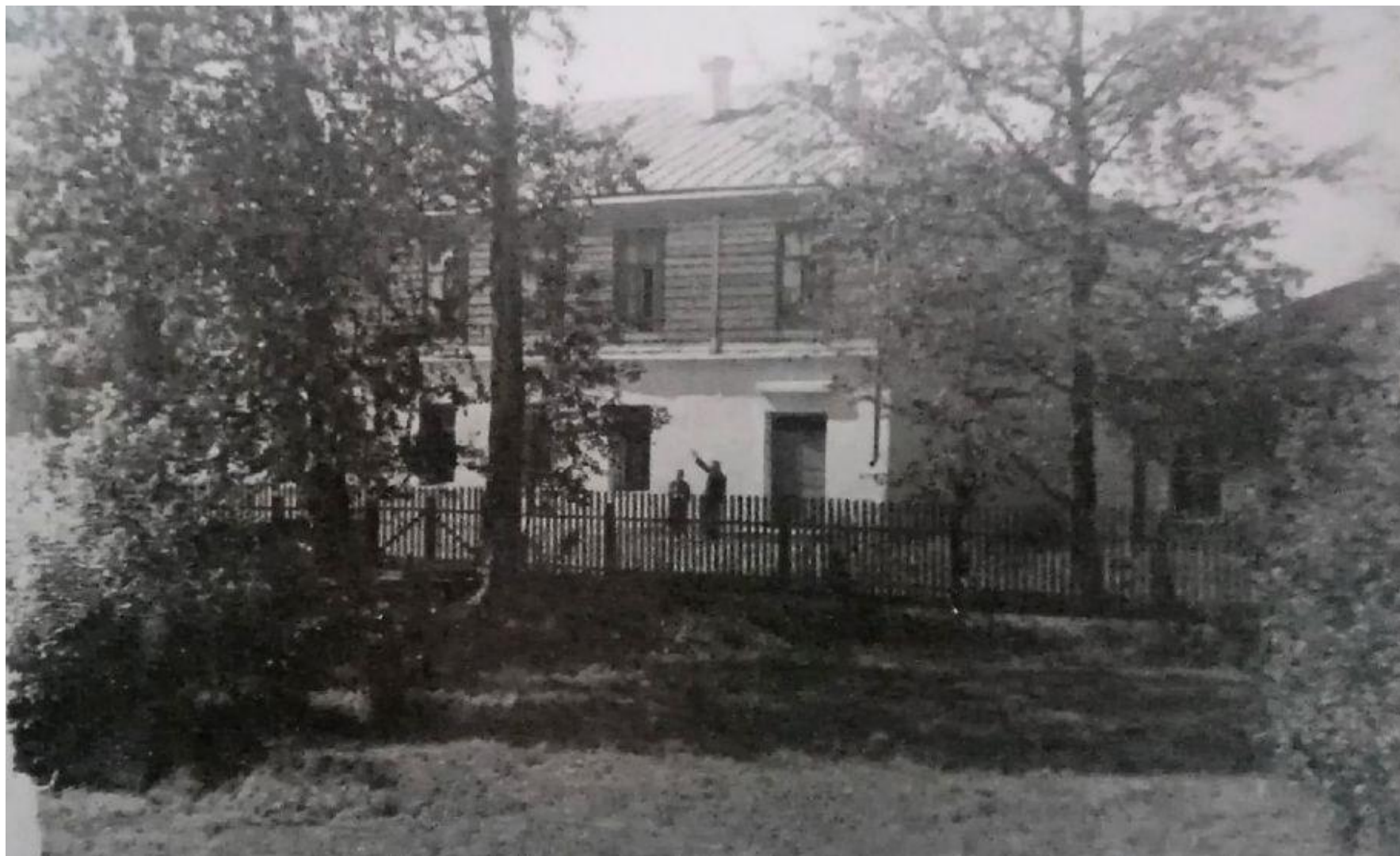
Васильев В.И. Загадка школы в Звонах