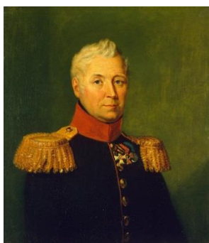
А.Т. Маслов. Худ. Дж. Доу. 1826 - 1828