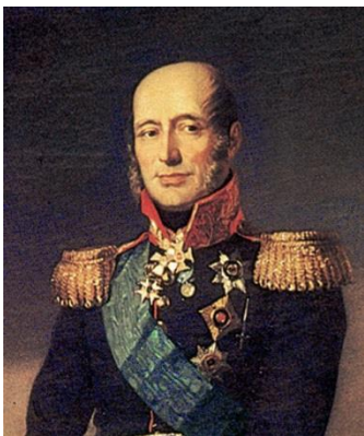
Фрагмент портрета М.Б. Барклай де Толли

Барклай де Толли Михаил Богданович (Михаэль Андреас) [13(24).12.1757 – 14(26).5.1818] – граф (1813), князь (1815), российский военный деятель, генерал-фельдмаршал (1814).