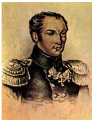
П.И. Пестель. Портрет работы неизвестного художника. 1820-е гг.

Похоронен на погосте Сергиевой пустыни (ныне поселок Володарского). Кладбище уничтожено.