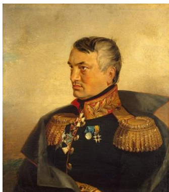
Н.В. Васильчиков. Худ. Дж. Доу

В 1846 году своим именем Рвы Дновского района (бывший Порховский уезд) построил каменную церковь в честь святителя Николая Чудотворца.