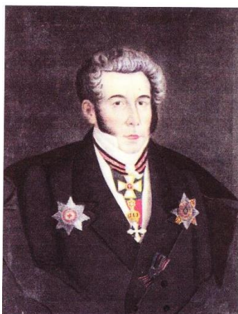
М.М. Бороздин. Неизвестный художник. Конец 1810 гг.

Бороздин Михаил Васильевич - ротмистр лейб-гвардии Гусарского полка погиб в сражении при Колоцком монастыре, Шевардине и Бородине 24 и 26 августа 1812 года (по старому стилю).