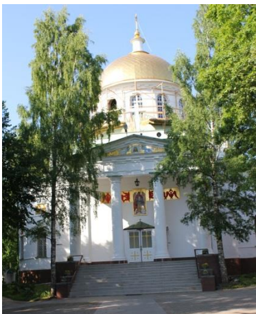
Собор Св. Михаила Архангела в Псково-Печорском Успенском монастыре. Фотография 2011 г.

Пока можно лишь констатировать, что единого памятника воинам Отечественной войны 1812 года в Псковской области нет, как нет и более-менее точных данных, сколько военнослужащих – участников Отечественной войны здесь похоронено, не сохранилось ни одной братской могилы.