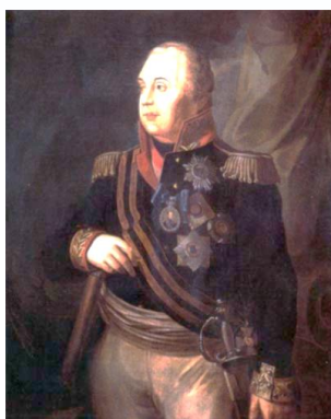
Портрет генерал-фельдмаршала светлейшего князя М.И. Голенищева-Кутузова-Смоленского. 1813 год работы Р. Волкова.