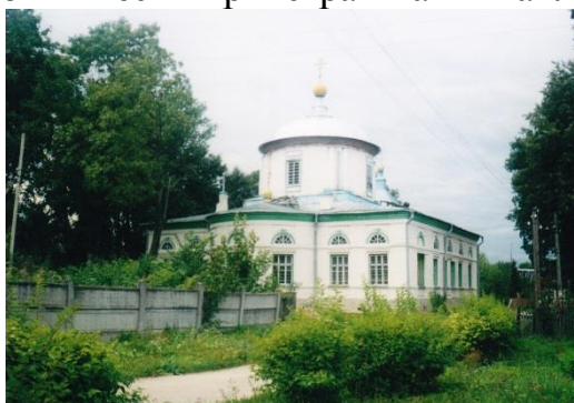
Михайловская церковь в Дно. 2006