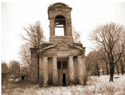
Церковь Ильи Пророка в Княжих Горках. Современная фотография.

В бывшем имении Князьи Горки (ныне Красные Горки) Дедовичского района еще стоит разрушающаяся церковь Ильи Пророка, построенная в 1833 году Кожиним Григорием Артамоновичем (? - 13 ноября 1863) – полковником, участником Отечественной войны 1812 года в честь победы над Наполеоном.