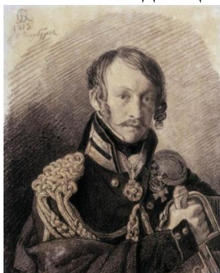
Портрет А.П. Ланского 1813. Бумага, итальянский карандаш.

Последние годы Павел Сергеевич жил в Петербурге и похоронен на Волковом православном кладбище.