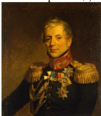
П. П. Коновницын. Художник. Дж. Доу, 1821-1822