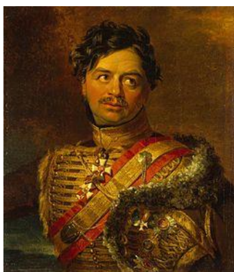
И.В. Васильчиков.

В Военной галерее 1812 года Зимнего Дворца в Петербурге хранятся портреты трех братьев Васильчиковых (Иллариона, Дмитрия и Николая).