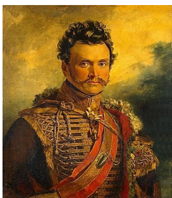
Д.В. Васильчиков. Худ. Дж. Доу. 1822-1827