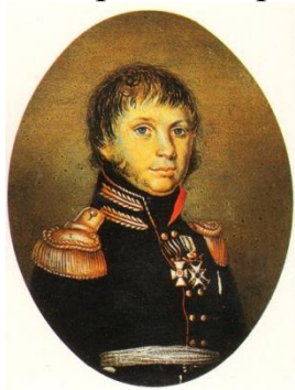
А.С. Фигнер. Неизвестный художник. 1-я половина. XIX в.

Дмитрий Федорович похоронен на погосте Облучье.