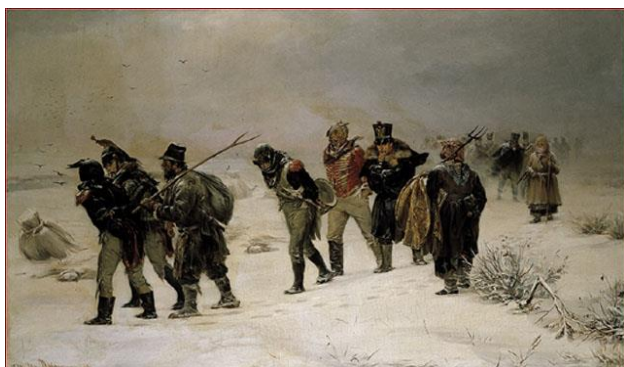
Французы в 1812 году, плененные партизанами. И. М. Прянишников.

Мы не будем разбирать весь ход войны. Читатели, в общем, знают о войне по школьным учебникам. Важен итог! Главным итогом Отечественной войны 1812 года стала гибель французской армии в России. Кутузов писал в конце кампании: «Неприятель с бедными остатками бежал за границу нашу». Маршал А. Бертье, докладывая Наполеону о катастрофических потерях, вынужден был сделать печальный вывод: «Армии более не существует». Армия Наполеона как боевая сила перестала существовать. В условиях полного разложения французы, несмотря на подход ряда свежих частей, уже не смогли закрепиться ни на одном рубеже на западной русской территории. Уже в конце декабря русские вошли на территорию Восточной Пруссии и герцогства Варшавского. Их потери за всю кампанию оцениваются в 200-300 тысяч человек. Наполеону удалось вывести из России от 20 до 80 тысяч человек (офицерские кадры основной группировки и остатки фланговых корпусов). Свыше 550 тысяч солдат из стран Западной Европы нашли свою смерть или попали в плен в России.