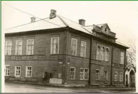
Фото 3. Дом Игнатовича в 1970-е годы – общежитие педагогического училища.