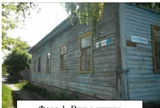
Фото 1 Вид с улицы