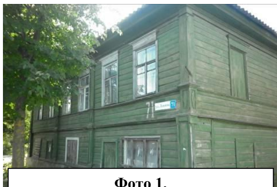
Фото 1. Дом Кудрявцевых (ул. Ленина 71) (фото Андреева Д., май 2014)