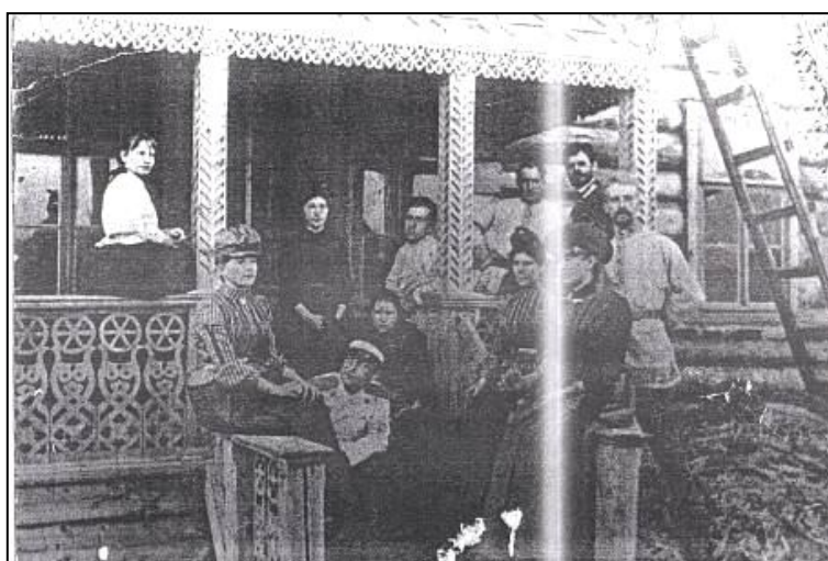
Фото 3. Семья Почепцовых с родственниками на крыльце своего дома. (дата на снимке не указана)