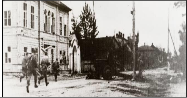
Фото 4. Освобождение Опочки. Улица Ленина (слева дом Игнатовича). Июль 1944 г.