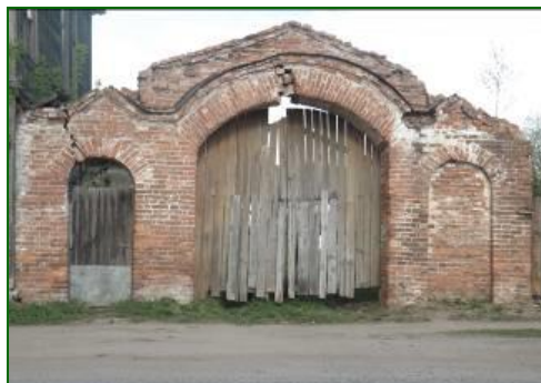
Фото 2. Кирпичные ворота Фото Андреева Д., май 2014