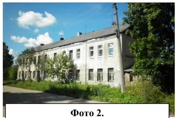
Фото 2. Бывший амбар, затем склад Кудрявцевых, сейчас жилой дом (фото Андреева Д., май 2014)