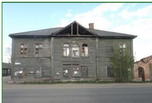
Фото 1. Вид со стороны ул. Ленина. Фото Андреева Д., май 2014