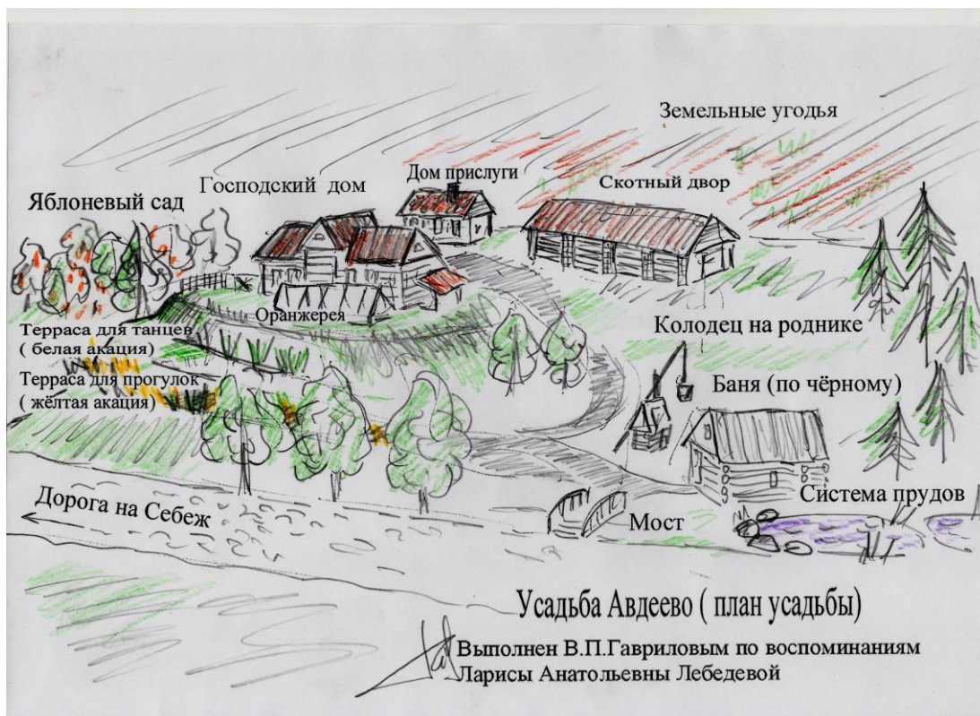
План имения Авдеево